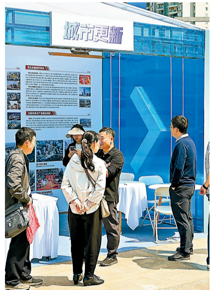
城市更新展区受到逛展人的高度关注。

“文化不是营销噱头,而是产品力的核心组成部分。”武汉城建集团绍兴片项目设计师雷超介绍,让建筑融入里份的历史元素,就是为了让居民留存对地域历史