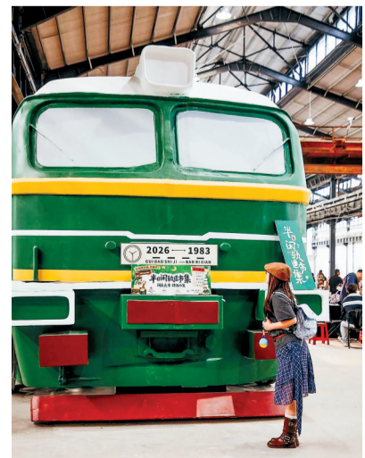
绿皮火车头等怀旧设施同样吸引了市民游客拍照打卡。