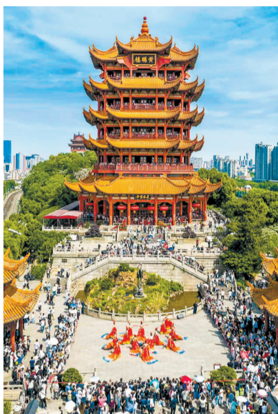
黄鹤楼公园“五一”人气旺。

步入状元台,青石台阶上镌刻着黎淳的《读书铭》——“读书好,读书好,读得书多无价宝”;一旁的卧石刻有他的生平简介与《状元卷》节选。“状元台”三个大字由茅盾文学奖获得者熊召政先生题写,笔力遒劲,更添文气。游客在此驻足诵读,仿佛穿越时空,与先贤对话。