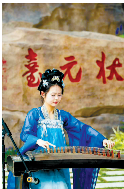
黄鹤楼新文化景观“状元台”。

驻足拍照,纷纷表示:“没想到黄鹤楼还有这样的背景,我们特意在《状元卷》石刻前许了愿,希望自己考研顺利上岸。”