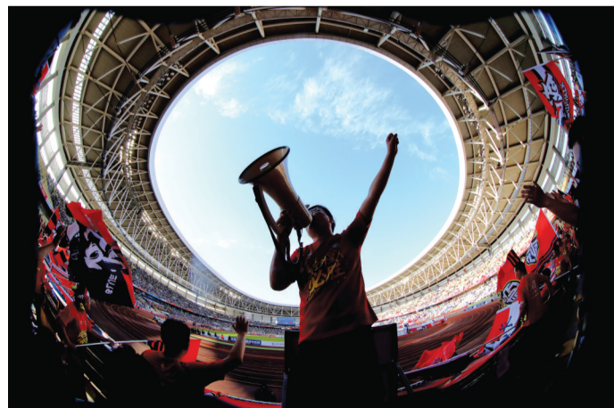
△《为“楚超”加油的球迷》 作者:郭贤乐(77岁) 东西湖区吴家山街道杏园社区