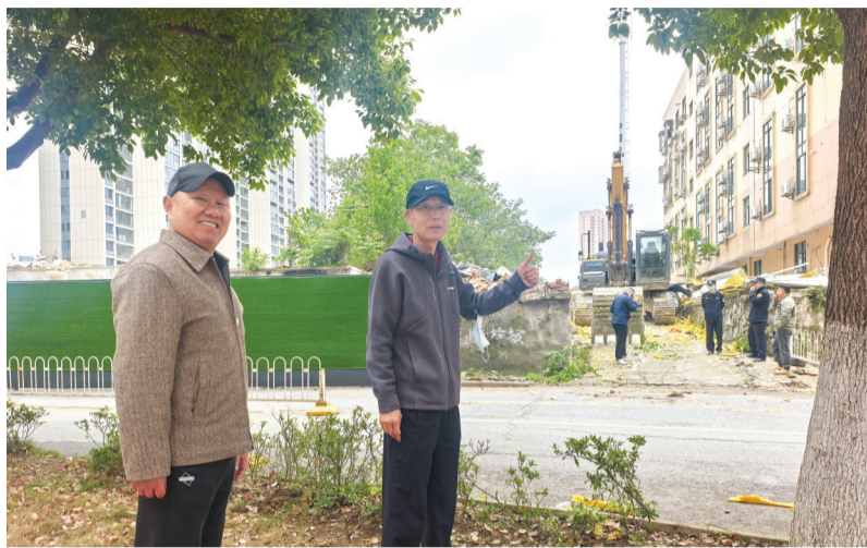
居民为拆除隐患工棚点赞。

4月22日,五里墩街道联合多方力量,对这片总面积达3700余平方米的工棚开展集中拆除行动。经过一整天规范作业,所有危棚全部清零,建筑垃圾及时清