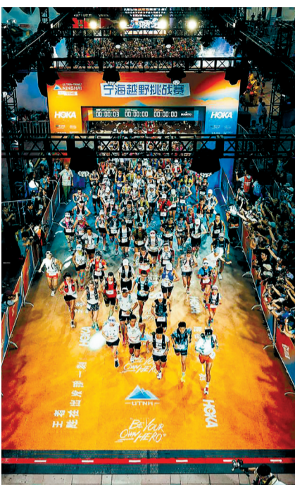
2025宁海越野挑战赛比赛现场。

从马拉松到越野跑，跑者们形象地称之为从“跑马”到“跑山”。新潮流的背后，是什么？