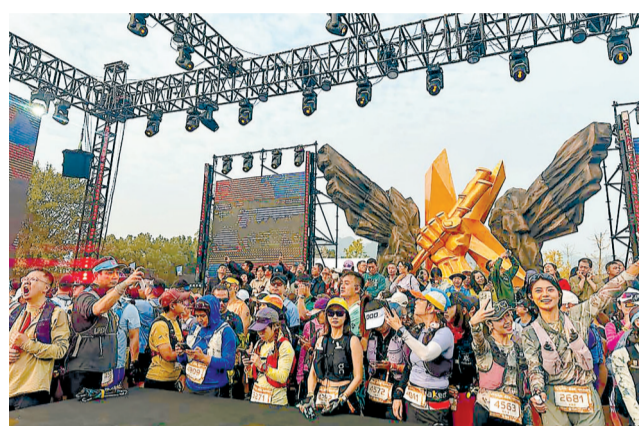
2025温岭黄金海岸跑山赛比赛现场。