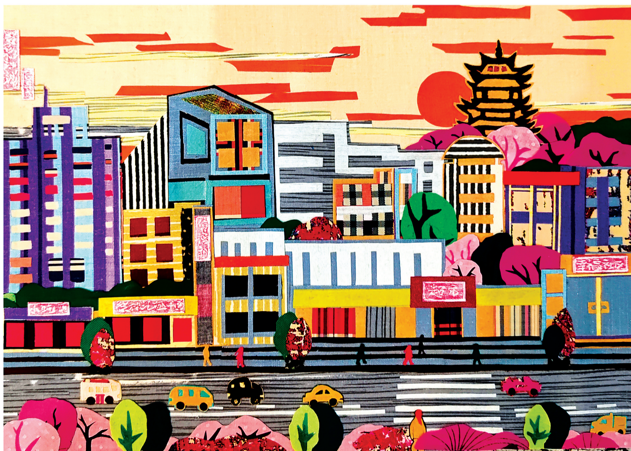
楚风布画《多彩江城》 作者:占文秀(57岁) 洪山区洪山街道幸福社区