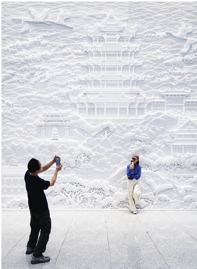
很多市民游客驻足拍照欣赏。