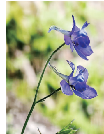
《紫韵微尘》