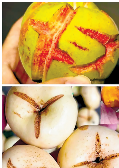
“爆炸桃”就是裂了的桃子。