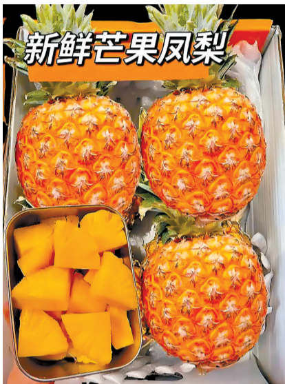
“芒果凤梨”是杂交培育的品种。