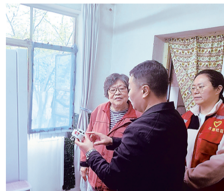
△工作人员为老人演示烟感报警器的使用方法。