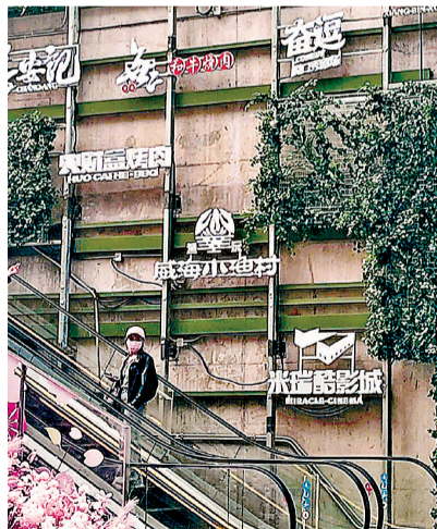
园区每月更新活动日历。