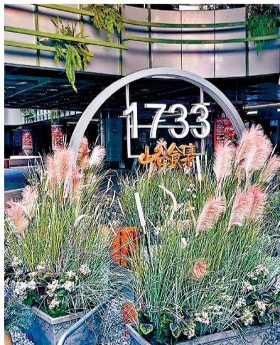
山谷食集是核心人气地标。

整个街区摒弃了封闭连廊和紧凑柜台,错落排布的方盒建筑、蜿蜒延伸的绿植步道、通透开阔的天光穹顶层层递进,自然风穿行在街巷之间,草木清香萦绕周身。移步换景的沉浸式设计,让每一段行走都变得舒缓自在。沿途的商铺错落分布,没有刻意的密集排布,每一家都有自己的特色。街区还设置了熊猫主题打卡客厅、开放式儿童嬉戏区,搭配原