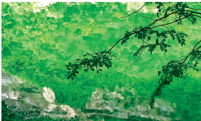
◁ 《和谐家园》国画 作者:何兵(80岁) 洪山区关山街道汽标社区