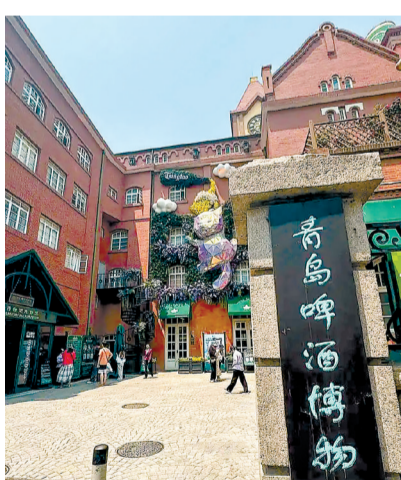
在青岛啤酒博物馆,百年老厂房被悉心改造。