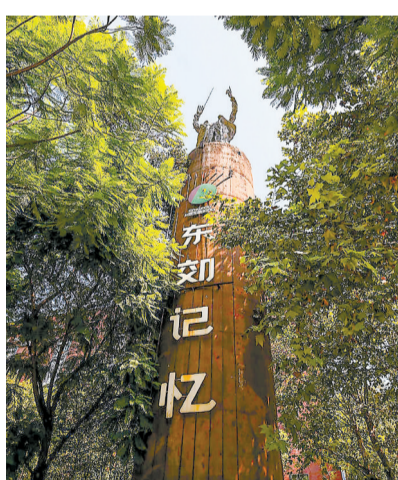
东郊记忆前身是始建于1958年的成都国营红光电子管厂。