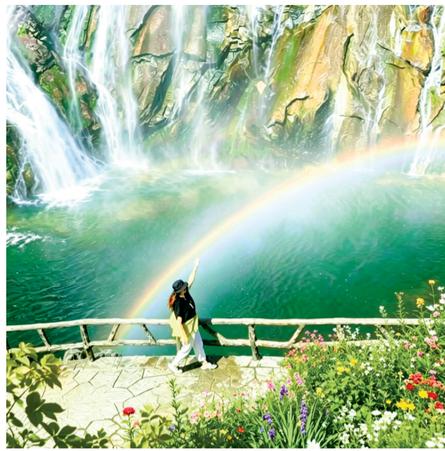
◁ 《凤凰》汉绣 作者:蒋晨芳(45岁) 汉阳区江堤街道江欣苑社区