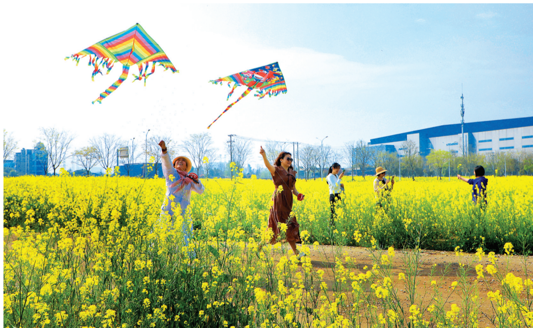
△ 《市民花田放风筝》 作者:肖汉凤(70岁) 硚口区荣华街道荣西社区