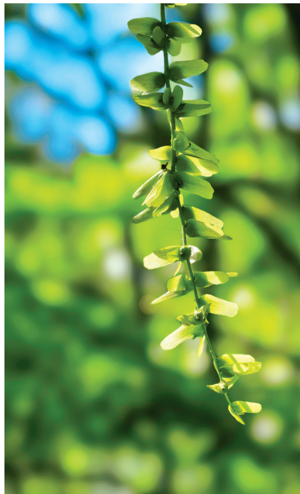
《绿玉垂绦》 作者:王燕(61岁) 武汉老年大学