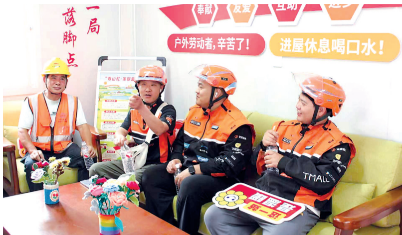
施工人员和外卖小哥在“暖新驿站”休息。

集装箱变了样。门口挂了块牌子,写着“暖新驿站”。门敞着,能看见里头摆着桌椅、饮水机、微波炉、小冰箱,还有几排充电插座。两个阿姨正往桌上摆放手工钩织的杯套和花束,花花