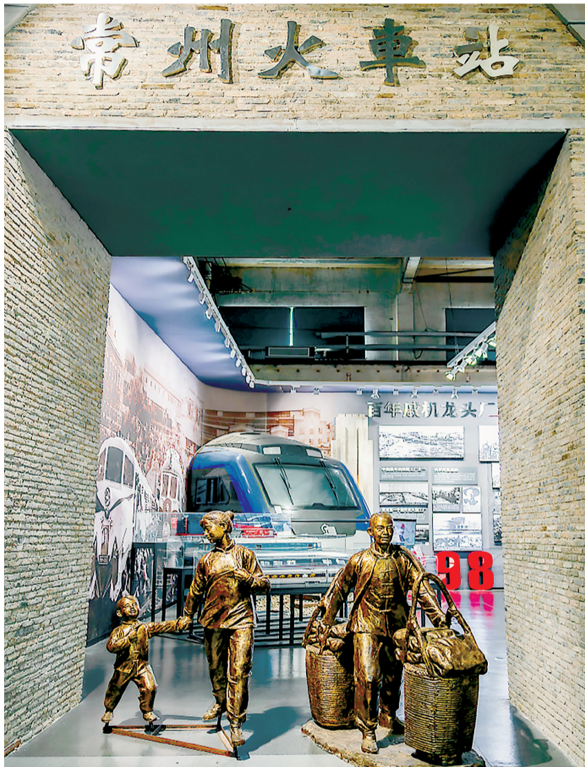
常州大运河工业遗产展览馆位于中车戚墅堰机车有限公司原动力车间。