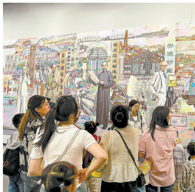
讲解员介绍实业家的故事。

立，机身清晰的百年钢印，诉说着中国铁路工业起步的艰难岁月。小记者们围站在设备旁纷纷提问：“这台机器一百多年前没有电动辅助，工人是如何操作的？”“老机器历经战火搬迁，为什么还能完好保存至今？”面对孩子们的好奇追问，讲解员逐一细致解答，让大家深刻明白，这台“钢铁元老”从上海吴淞江畔迁徙至常州运河