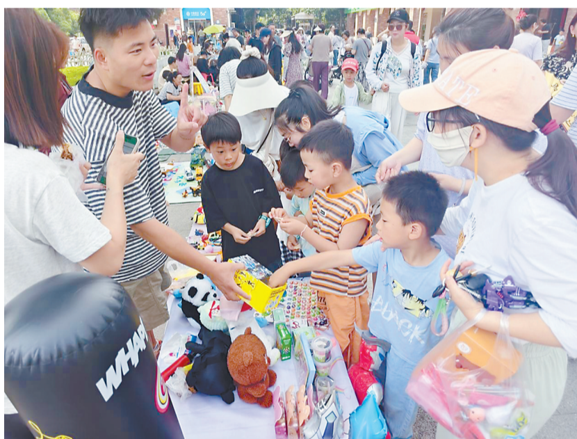
萌娃在闲置互换小集市体验练摊。

随后，“萌娃闲置互换小集市”正式开张。一个个小摊位上整齐摆放着玩具、闲置的文具和看过的绘本。孩子们化身“小老板”和“小顾客”，有模有样地交流协商：“这本书很有趣，希望你喜欢！”“可以用我的小汽车换你的玩偶吗？”稚嫩童声中，闲置物品通过互换实现物尽其用。家长们表示，活动既锻炼了孩子的沟通能力，也让节约资源、循环利用的绿色理念