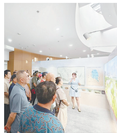
党员们开展研学活动。