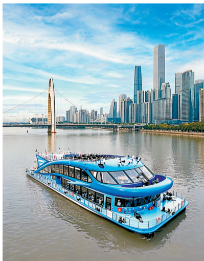
游船行驶在广州珠江水面上。