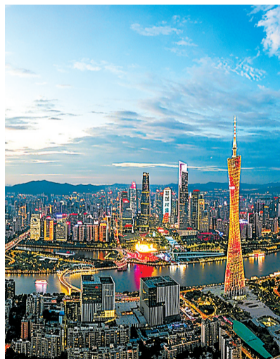
“小蛮腰”与珠江两岸城市璀璨灯火交相辉映。