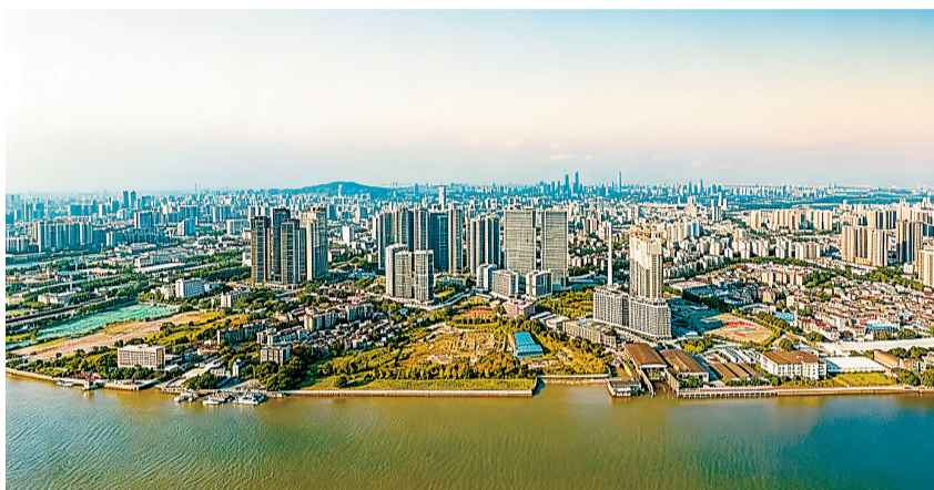
广州珠江后航道广纸片区蝶焕新。

广纸片区的战略价值,从官方文件中可窥一二。《广州市海珠区国土空间总体规划(2021—2035年)》明确“重点围绕琶洲、新中轴线、广纸等片区,推动地上地下一体化发展”。将广纸与琶洲、新中轴线并列重点推进,其战略分量不言而喻。2026年的广州市两会上,海珠区进一步明确:“十五五”时期将优化提升“一区一谷一圈一轴一环一带”六大片区空间能级,其中“一圈”即海珠新活力文商旅融合圈,正是广纸