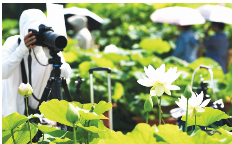
武汉沙湖公园荷园的荷花已进入盛花期,市民纷纷前来赏荷拍照。