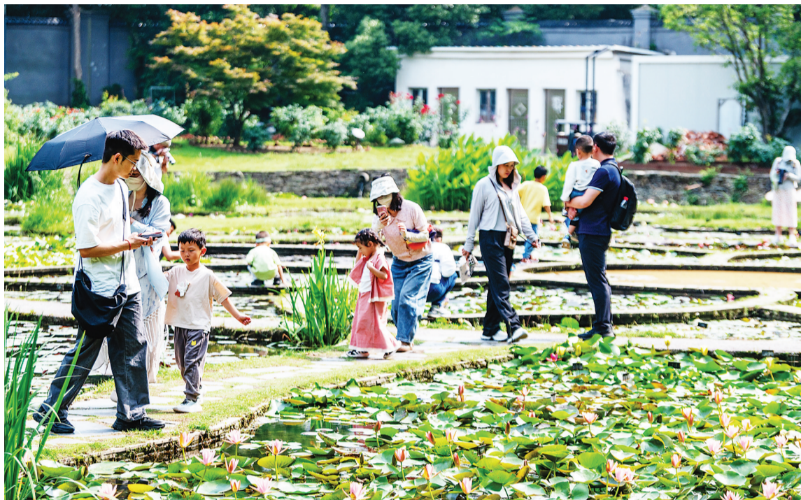
中国科学院武汉植物园睡莲展示区。

除了城市公园,武汉还有多处湿地自然保护地可以赏荷。其中,沉湖国际重要湿地、上涉湖湿地省级自然保护区还有国家二级保护植物野莲可赏,中国科学院武汉植物园荷花展示区也种有野莲。