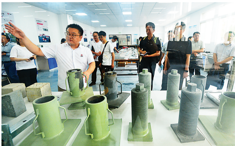
迈赫特(武汉)实业有限公司工作人员向观察团成员介绍公司的产品样品。

民用领域转移转化的通道，同时推动民用创新成果服务国防建设，拓宽市场应用空间，培育新的增长极。