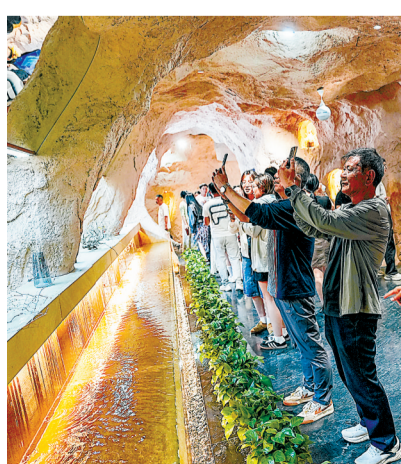
游客在敦煌净界一楼拍照打卡。

屏、行李寄存柜、充电口、休憩区等细节功能，兼顾实用性与体验感。由于装修设计富有当地特色，不少游客不远千里专程打卡，直言逛敦煌夜市，一半为品尝美食，一半为体验这座网红厕所。