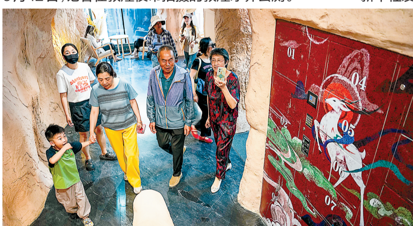
游客在一楼参观时经过一处绘有敦煌元素的储物柜。