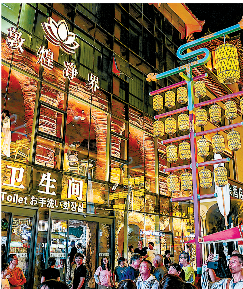
6月12日，记者在敦煌夜市拍摄的敦煌净界公厕。