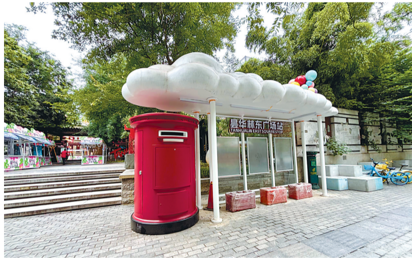
△ 昙华林东广场站点。