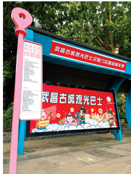
武昌古城观光巴士汉阳门花园站候车亭。