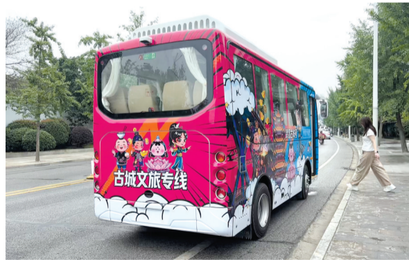
◁ 武昌古城观光巴士车身是国潮手绘风格的图案。