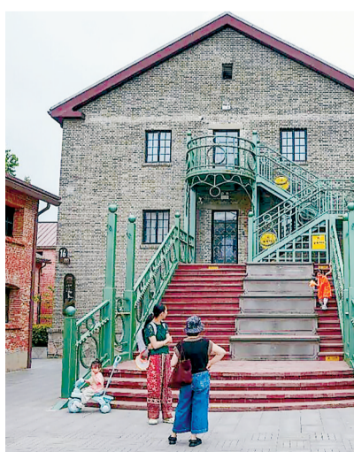
浦口火车站历史文化街区。