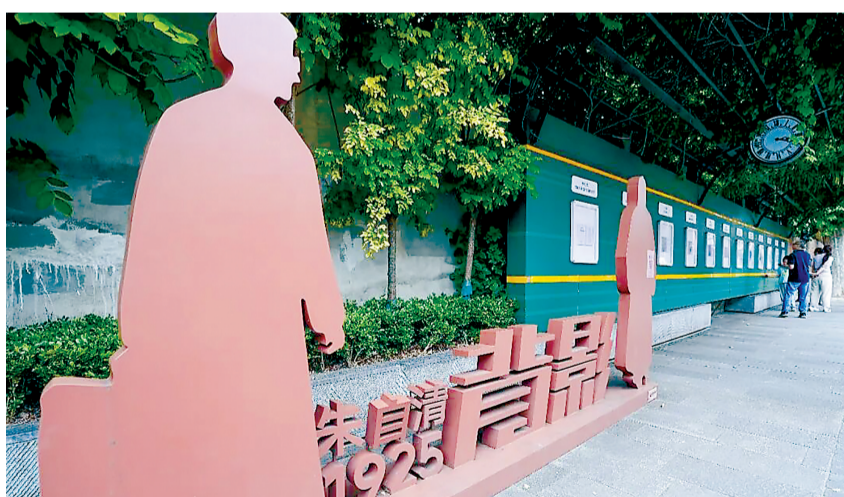
6月13日，游客在浦口火车站历史文化街区游览。