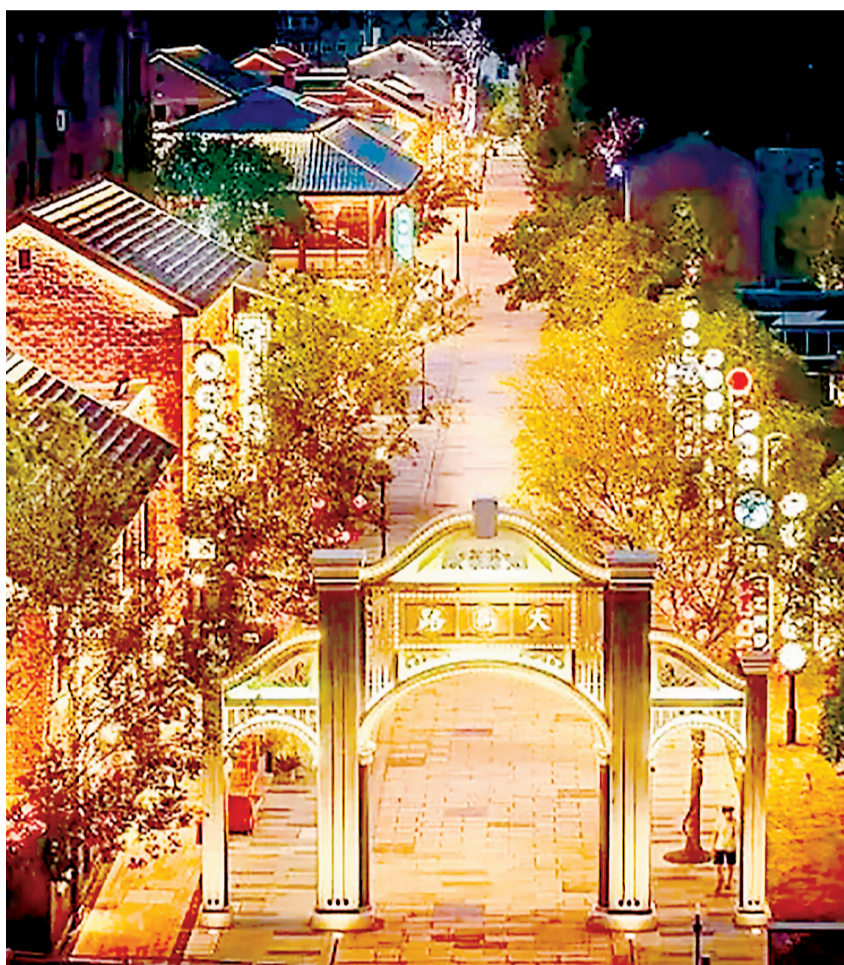
南京浦口火车站历史文化街区文商旅综合体。

浦口火车站是特色工业遗存，本身也是承载离别、相聚情绪的情感枢纽。设计团队以朱自清名篇《背影》为核心切入点进行活化改造，唤醒大众的集体记忆与