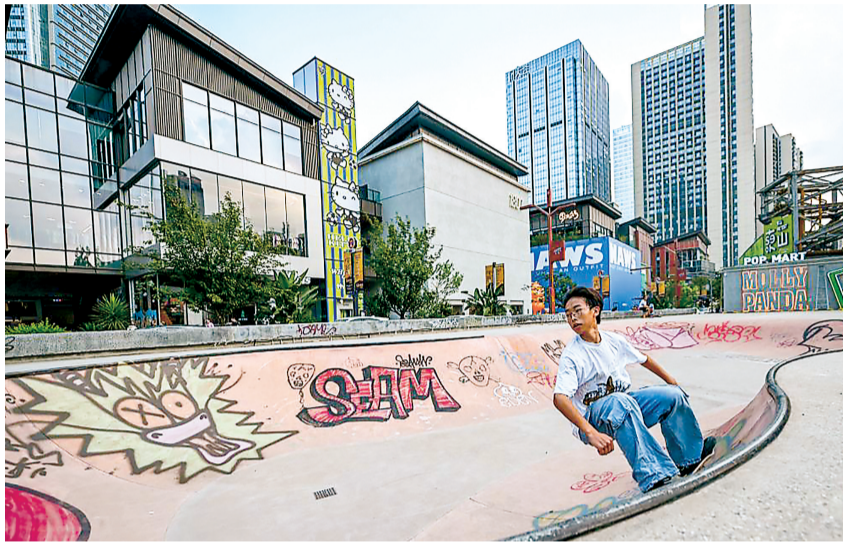
成都成华区东郊记忆滑板场，一名爱好者在练习滑板。

这座始建于1907年的工厂，位于城区早期中心位置，是中国开办最早的三家水泥企业之一。人民大会堂、武汉长江大桥、三峡大坝都曾用过它生产的水泥。